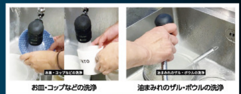
お皿・コップなどの洗浄

汚れの隙間に入り込み、やさしい研磨剤の役割を果たします。また、疎水的吸着性によりフライヤーなどのしつこい油分汚れや、浸け置きでも汚れをふやかす力を存分に発揮し、洗浄作業の負担を軽減します。