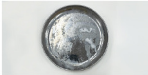
[ミラブルプロダイナーで20秒洗浄した様子]