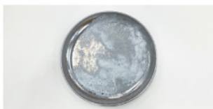
[ノーマルシャワーで20秒洗浄した様子]