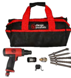
CP7160K / CP7165K (タガネ5本付キット販売)