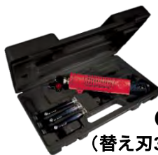
CP7901K (替え刃3セット付キット販売)