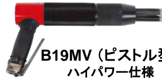
B19MV (ピストル型) ハイパワー仕様