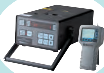
レーザーパーティクルカウンター