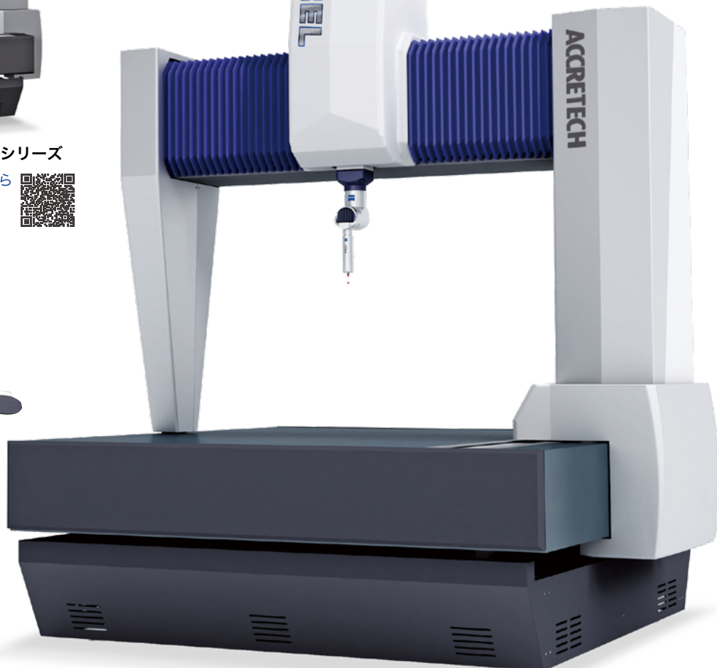
XYZAX AXCEL RDS シリーズ