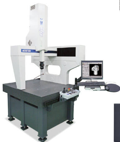
XYZAX mju NEX シリーズ