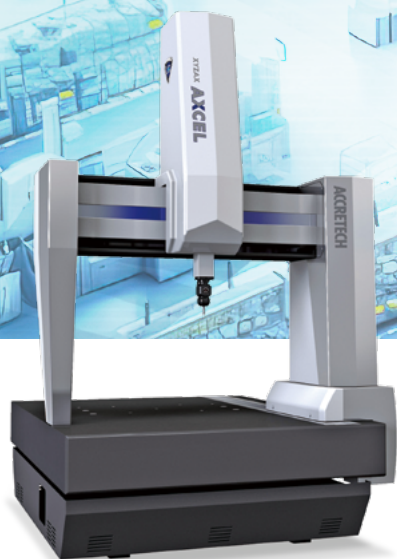
XYZAX AXCEL PH シリーズ